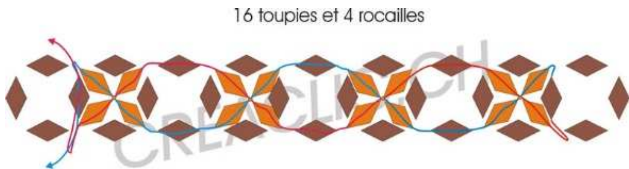
2 e niveau en toupies topaze clair