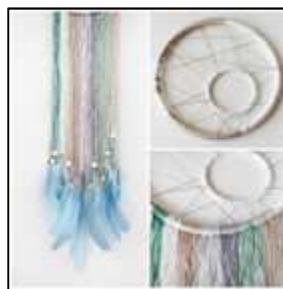
3 tons pastels détails