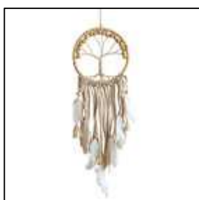
16 arbre de vie perles