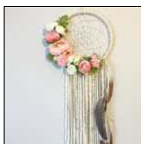
20 fleurs en papier