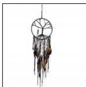
17 arbre de vie foncé