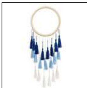
2 décor glands