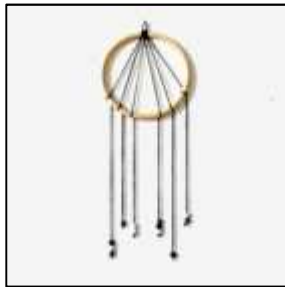
9 rayons avec perles