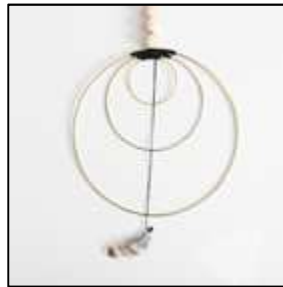
10 trois anneaux

Si votre intérieur est meublé dans un style contemporain, les modèles 8, 9 et 10 ci-dessus s'intégreront sans décrier; les formes étant épurées et simples. Ces projets sont faciles à réaliser et nécessitent peu de matériel, pour un rendu moderne.