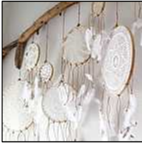
5 décor napperon