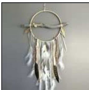
1 décor bois flotté