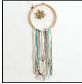
7 décor rubans

Le centre de l'attrape-rêve peut revêtir un décor très élaboré, qui sera facilement réalisé avec un napperon ou textile de type rideau; vous obtiendrez ainsi un effet dentelle du plus bel effet (photo 5).