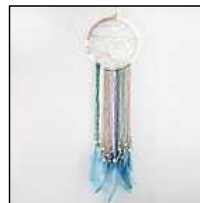
4 tons pastels ensemble

Si l'étape des cordons entremêlés vous semble rébarbative, inspirez-vous des modèles 1 et 2 ci-dessus; l'anneau de base reste vide ou simplement agrémenté d'un élément végétal (bois flotté ou branche sinueuse) et le décor est attaché au tiers inférieur de l'anneau. Plumes, cordes, laine, cuir, rubans ou même glands textiles pour un visuel élégant.