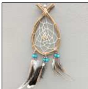
12 goutte bois épais