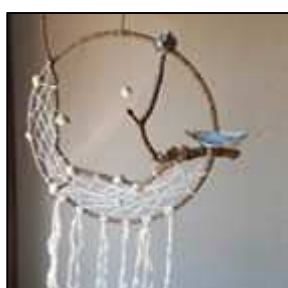
18 branche sinueuse