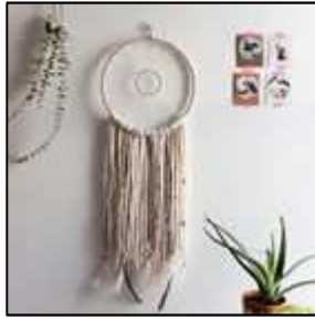
6 décor laine