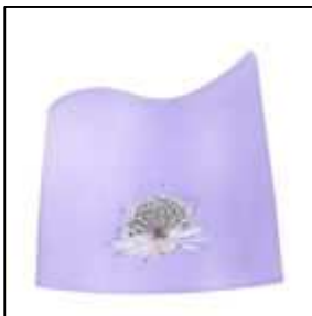
décor collage de serviette