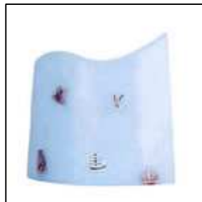
inclusions de petits objets en polyrésine