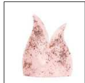
application en surface de paillettes avec un vernis à bougies

Pour la déco, de nombreux menus objets peuvent être intégrés dans la cire du paravent : grains de café, tranches d'orange séchées, épices (anis étoilé, grains de poivre), petits galets, fleurs / feuilles / brindilles et autres végétaux séchés, perles en verre, sequins, etc..