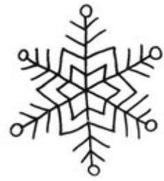
Modèles hiver, neige, Noël

Des cahiers de motif sont à votre disposition sous