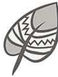
Modèle fleurs et feuilles