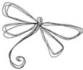
Modèles oiseaux et insectes