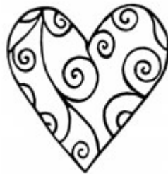
Modèles bordures, volutes, coeurs